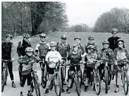
Die Bikergruppe in Astano

Nach einem spielerischen Aufwärmen auf einem Parkplatz fuhren alle eine schöne Tour durch malerische Dörfer im Malcantone. Trotz ein paar Stürzen kamen alle gesund zurück ins Hotel. Am zweiten Tag fuhren die grösseren Kids bereits von Pura nach Curio hoch. Nach einem längeren Techniktraining durften wir im Hotel Post in Astano einen Salat, Penne mit verschiedenen Saucen und Glacé essen – und dies notabene zu einem Preis von unter 20 Franken pro Person. Am Nachmittag kam dann die lange Abfahrt bis zum Flüsschen Tresa, der Wanderweg nach Ponte Tresa und der Schlusssaufstieg nach Pura hinzu. Auch danach folgte noch eine kleine Trainingseinheit mit einem Fussballspiel.