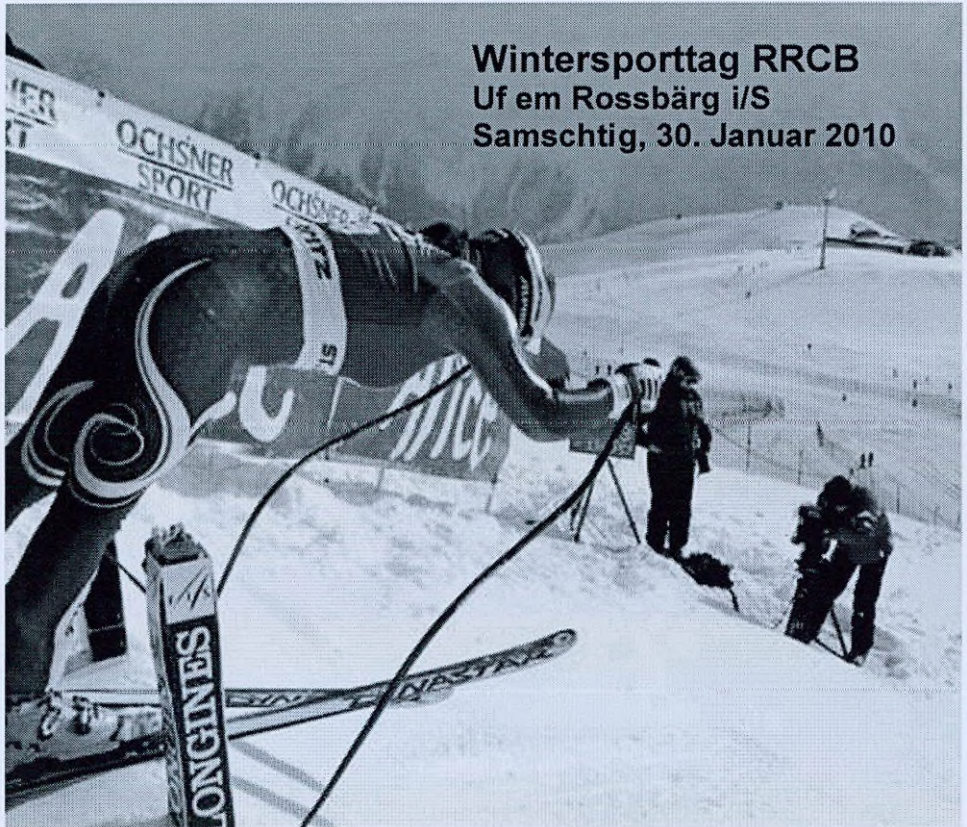
Wintersporttag RRCB Uf em Rossbärg i/S Samschtig, 30. Januar 2010